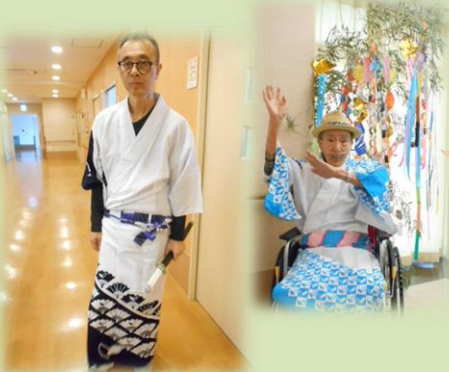
剣を持って役者さんみたいですね

うめ、ももユニットにて七夕浴衣レクが開催されました。色とりどりの浴衣を選び七夕飾りの前で写真撮影をしました。皆さま、とても素敵な浴衣姿です!! 普段なかなか着る事のない浴衣を着て夏らしい時間を過ごしました。